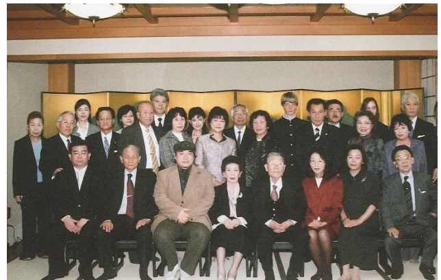
東久邇佳子様を囲む会 平成19年10月 京都萬重にて